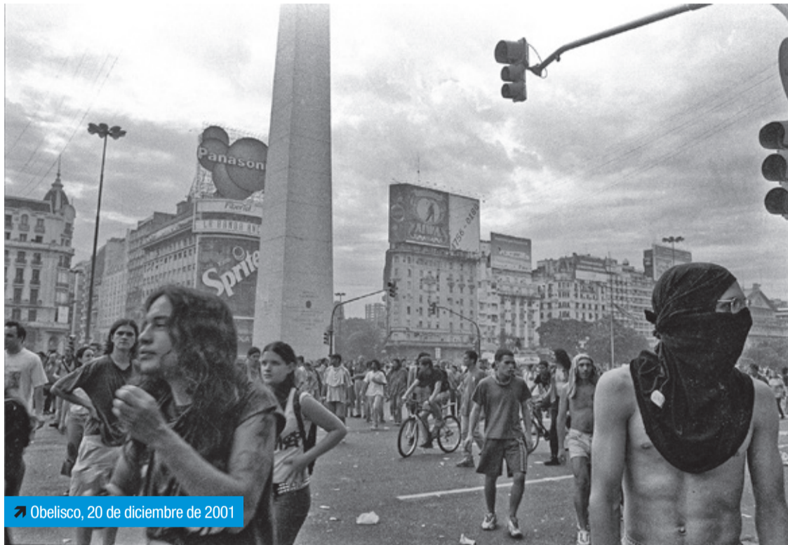
➤ Obelisco, 20 de diciembre de 2001

Cutral Có y Plaza Huincul fueron escenarios de grandes