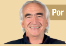
Por Ricardo Peidro