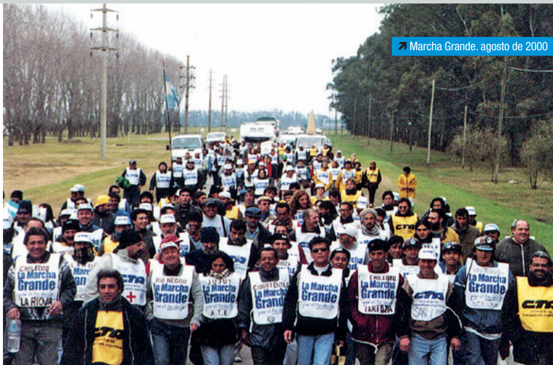
Marcha Grande. agosto de 2000

bajo. Este hecho fue uno de los más representativos de la recta final de las movilizaciones y piquetes que desembocaría en estallido social de diciembre de 2001 y la renuncia de Fernando de la Rúa y Domingo Cavallo.