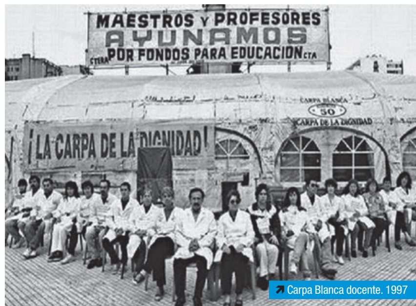
➤ Carpa Blanca docente, 1997