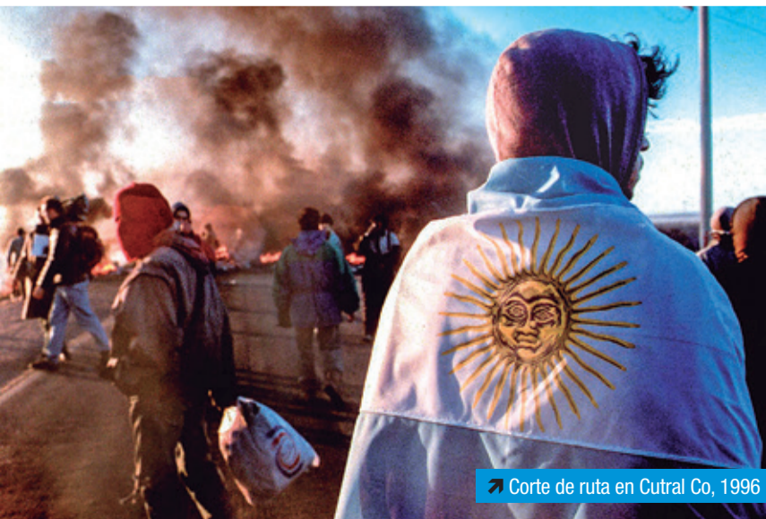
➤ Corte de ruta en Cutral Co, 1996

19 días de corte en la Ruta 3, a la altura de Isidro Casanova, en La Matanza, en mayo del 2001, la Corriente Clasista Combativa, la Federación Tierra y Vivienda y la CTA lograron arrancarle al Gobierno Nacional y de la provincia de Buenos Aires un compromiso de atención de las demandas de salud, educación y tra-