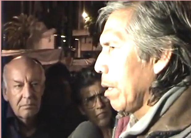
Apoyo a la resistencia qom. Acampe en Buenos Aires (2011).

"En Chiapas, los enmascarados desenmascararan al poder" "El desafío" (1995).