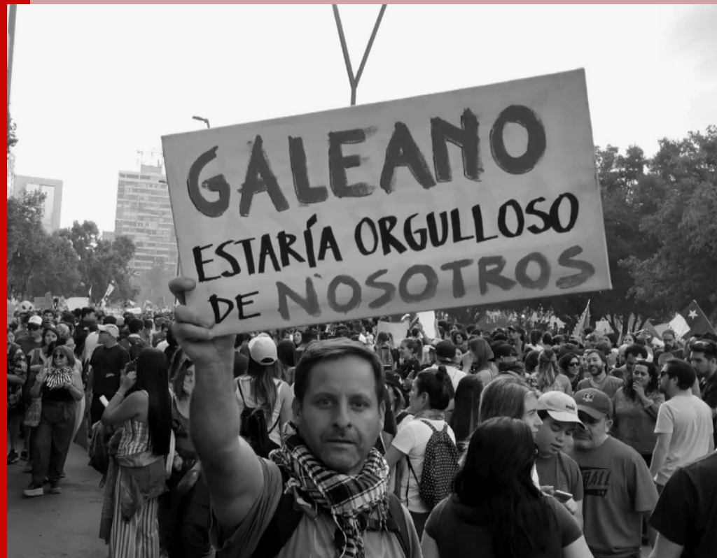
(Santiago de Chile, 2019)