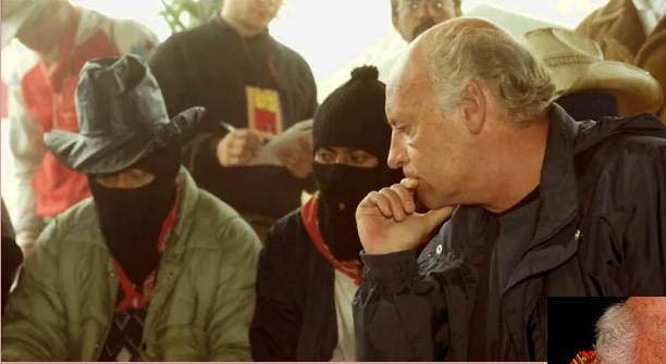
Carta del subcdte. Marcos a Galeano (1995).