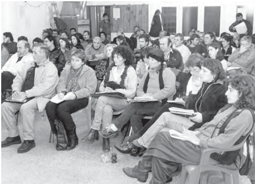
Panorama del público presente