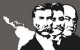
Felipe Varela (1821 - 1870) Manuel Ugarte (1875 - 1951) Arturo Jauretche (1901 - 1974)