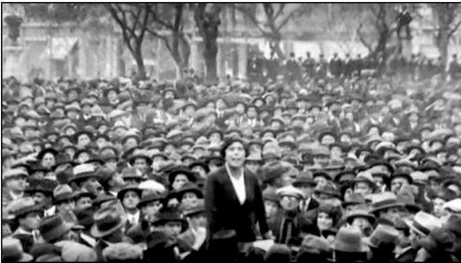
1927. Buenos Aires concentración en apoyo a Sacco y Vanzetti

“Mucho fue el elemento femenino que concurrió a este mitin. La palabra de nuestros compañeros quedará clavada como bandera de combate en el espíritu de este pueblo, y el odio a los gobiernos y en particular al norteamericano, se arraigará e irá aumentando hasta que un día no muy lejano caigan aplastados por sus propios crímenes y por la acción demoledora de nuestra conciencia y de las ideas de redención social que pregonamos”.