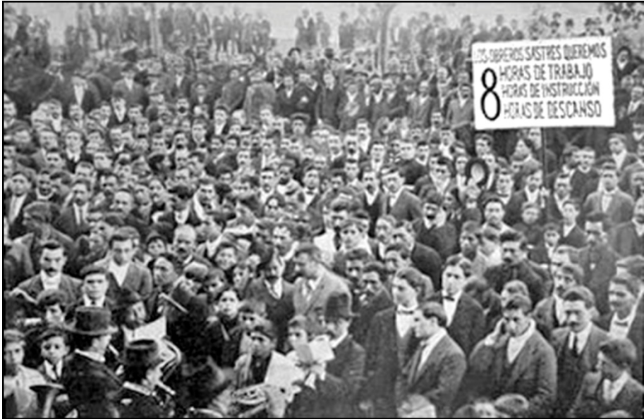
La lucha de la FORA por la jornada de 8 horas

primeras cartas! ¡era una niña, tenía 15 años! Me parecía que ya comprendía todos los problemas sociales y mi juventud y mi entusiasmo me llevaban a tomar parte en cosas que no comprendía bien pero que me gustaban.