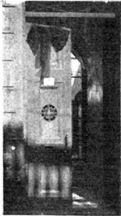
Puerta enlutada del conventillo donde fué velado el cadáver