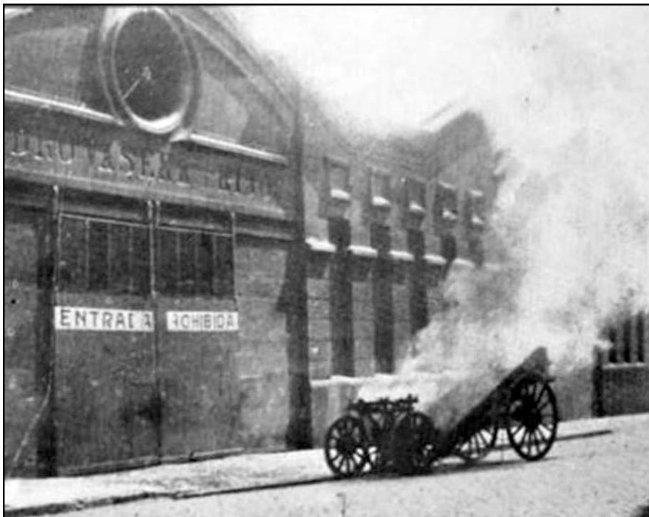
Los talleres Vasena

Puede comprenderse, que estos hechos corrieron como reguero de pólvora por toda la ciudad y que la indignación fue tanta, que las calles se inundaron de gente que querían asaltar el establecimiento, que estaba bien custodiado por la policía consentidora y cómplice de esos hechos.