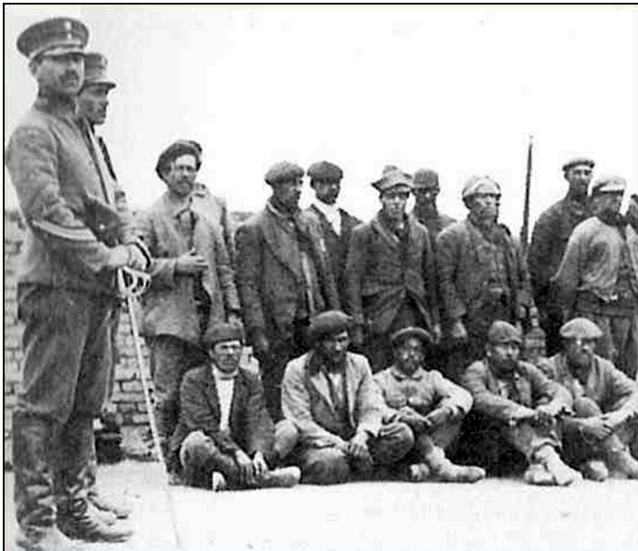
La Patagonia rebelde

Hay que comprender el dolor y la estupefacción que nos produjo la llegada del telegrama con semejante noticia. Después de varios días cuando apareció el cuerpo, los padres y un hermano se fueron a Río Negro y trasladaron el cadáver a Buenos Aires, donde le dieron sepultura. Muy acongojados quedamos por la pérdida de tan querido compañero, pues fue un gran dolor por su juventud y su capacidad.