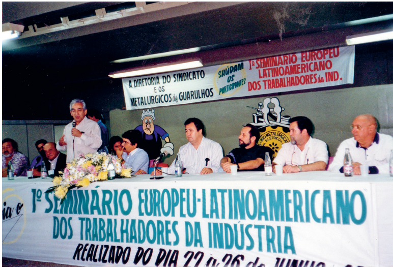
Seminario Europeo-Latinoamericano de los Trabajadores de la Industria (San Pablo – Brasil, 1992)