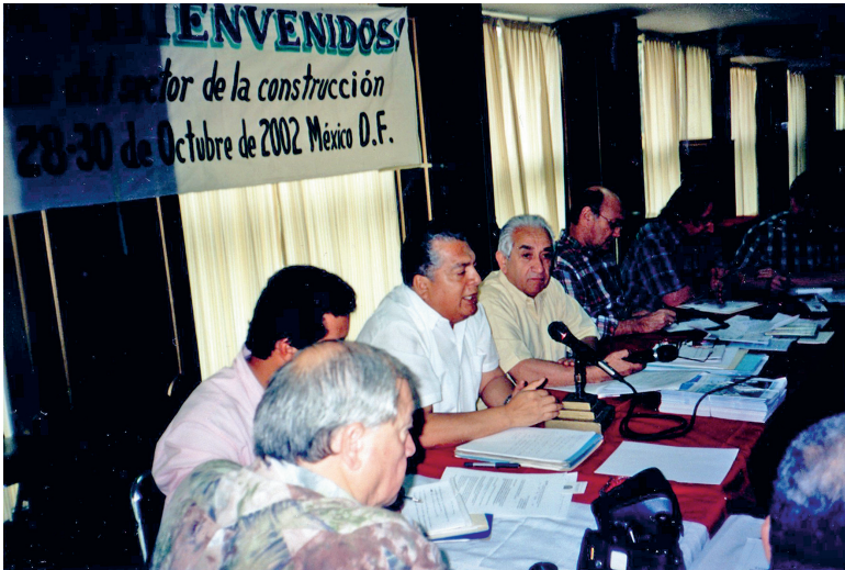
Consejo Construcción (México)