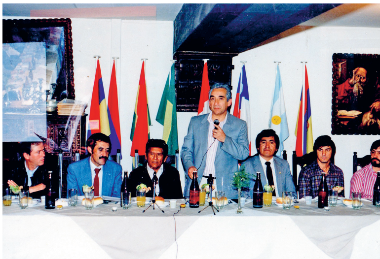
Constitución Consejo Profesional Energía y Petróleo (Lima - Perú)