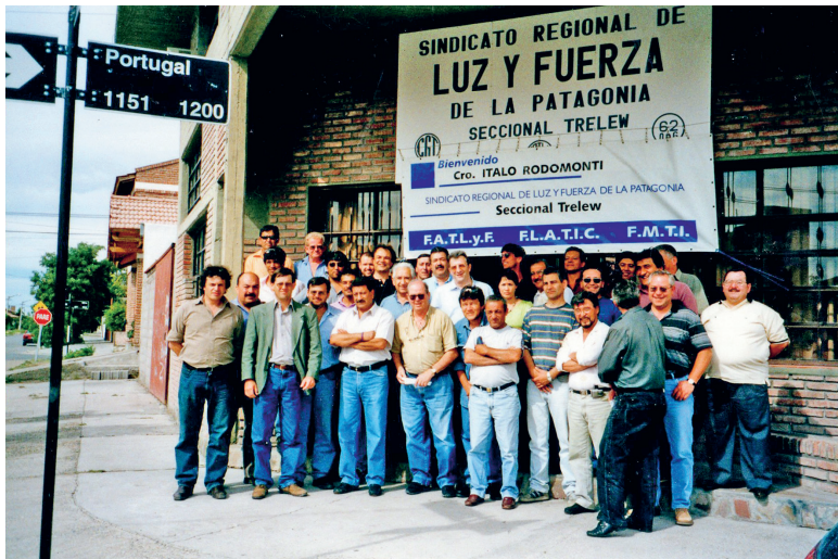
Sector Energía Eléctrica, Gas y Carbon (Patagonia – Argentina)