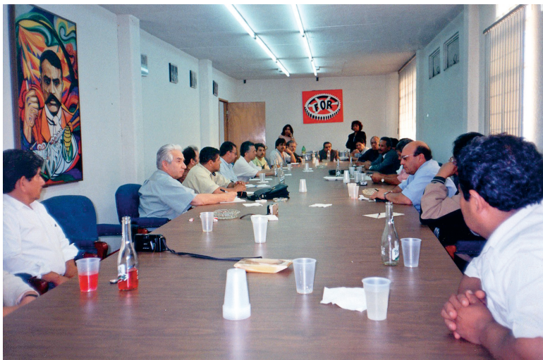
Reunión Latinoamericana (México)