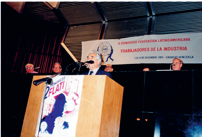
2º Congreso de la FLATI (Caracas – Venezuela, 1990)