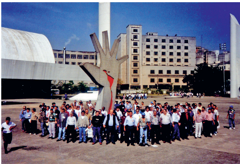
Encuentro Sindicalistas Latinoamericanos (San Pablo – Brasil)