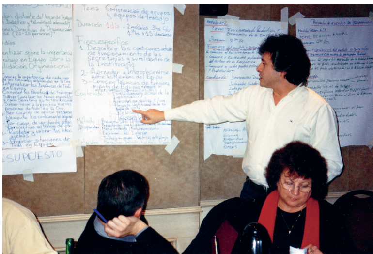
Proceso de Formación y Capacitación de Dirigentes