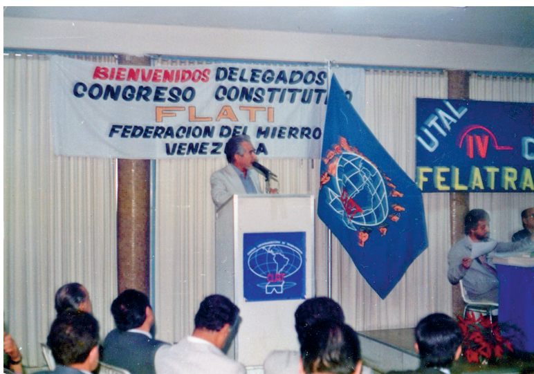
Congreso Constitutivo de la FLATI (UTAL, Caracas – Venezuela, 1986)