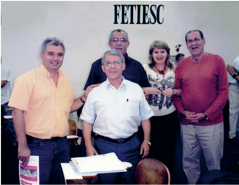
Reunión del Sector Textil, Vestuario, Calzado y Cuero (Santa Catarina – Brasil)