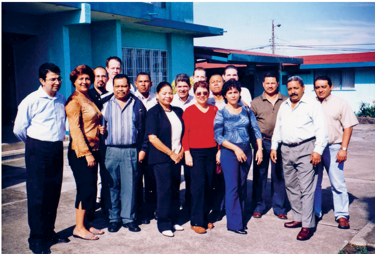
Formación Centro América y Caribe (Costa Rica)