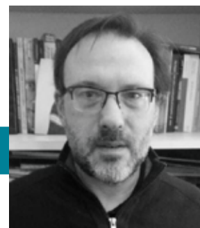
POR PABLO GRANOVSKY ODET. FUNDACIÓN UOCRA

Los resultados serán próximamente publicados en un libro que compilará las principales experiencias. ■