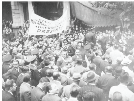
El Sindicato de Mucamas el 1º de mayo de 1948 en la Plaza de Mayo.

inviabile, con la excepción de pequeñas representaciones organizadas por la Federación de Asociaciones Católicas de Empleadas. 54 Un año antes había hecho acto de presencia en la Plaza de Mayo el cercano Sindicato de Mucamas, Valets y Auxiliares de Hoteles.