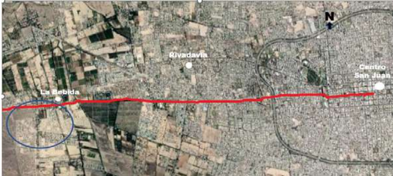
Figura 1. Localidad de La Bebida, Departamento Rivadavia, San Juan