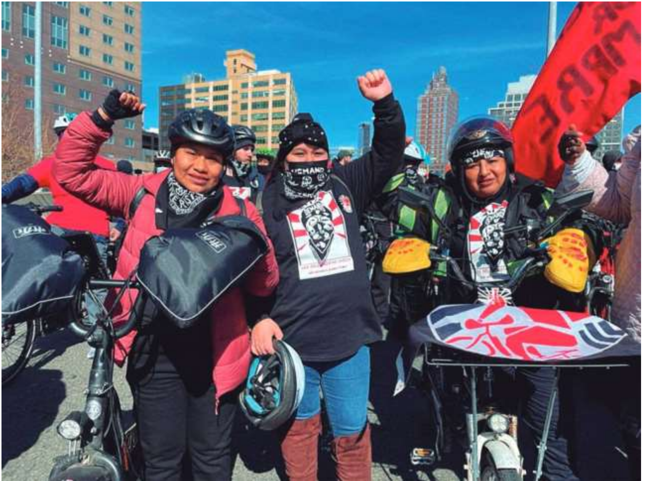
Deliveristas unidos en Nueva York.