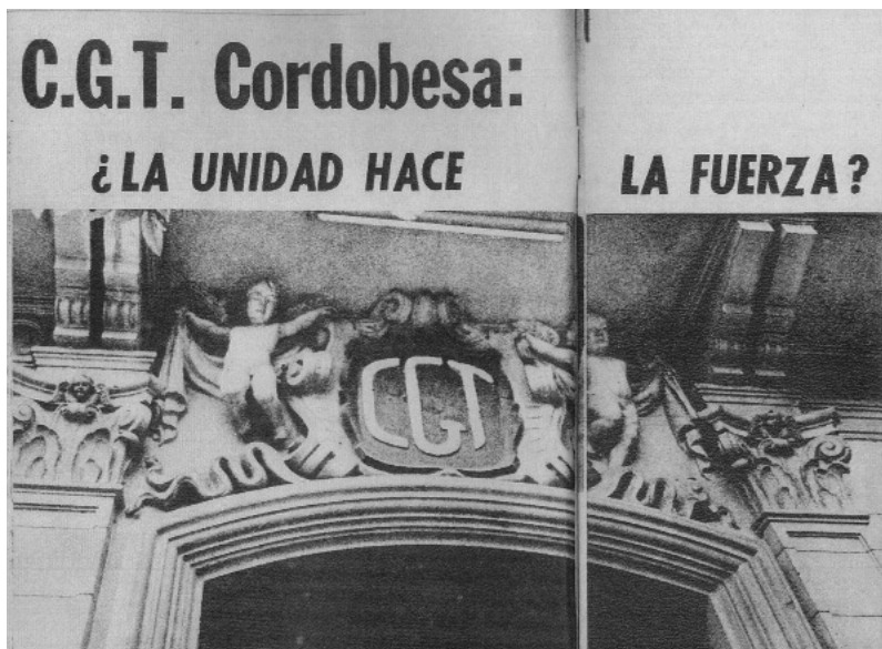
Sede de la CGT Regional Córdoba, ubicada en la calle Vélez Sarsfield 137, en pleno centro de la capital cordobesa.